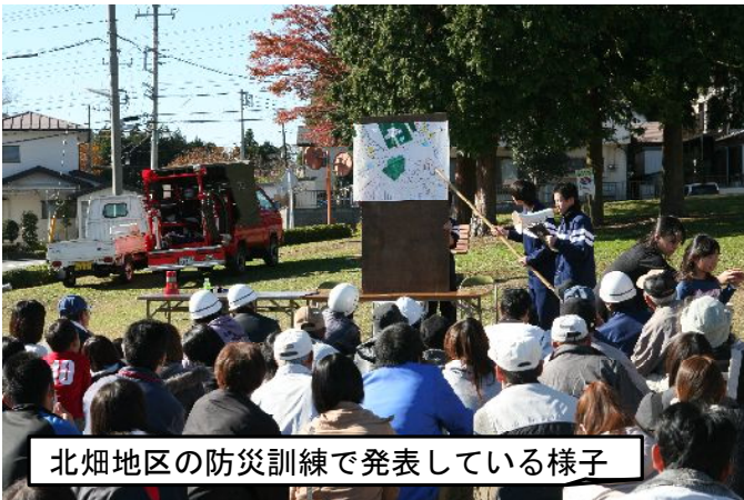
北畑地区の防災訓練で発表している様子